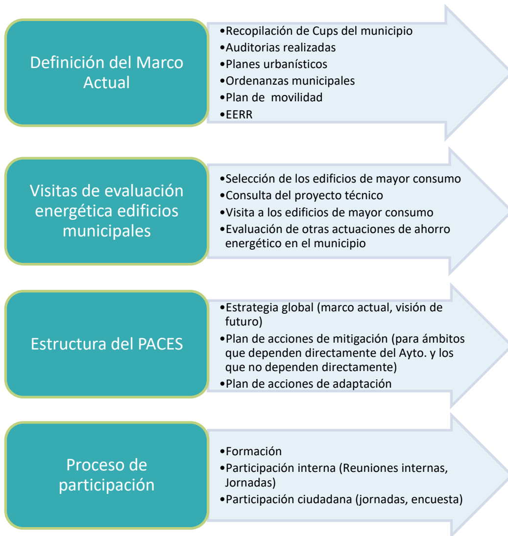
Gráfico 3. Diagrama de flujo de la metodología seguida para la realización de los planes de acción.

La metodología seguida para la realización de los planes de acción ha sido la presentada en el Gráfico 3, mostrada a continuación.