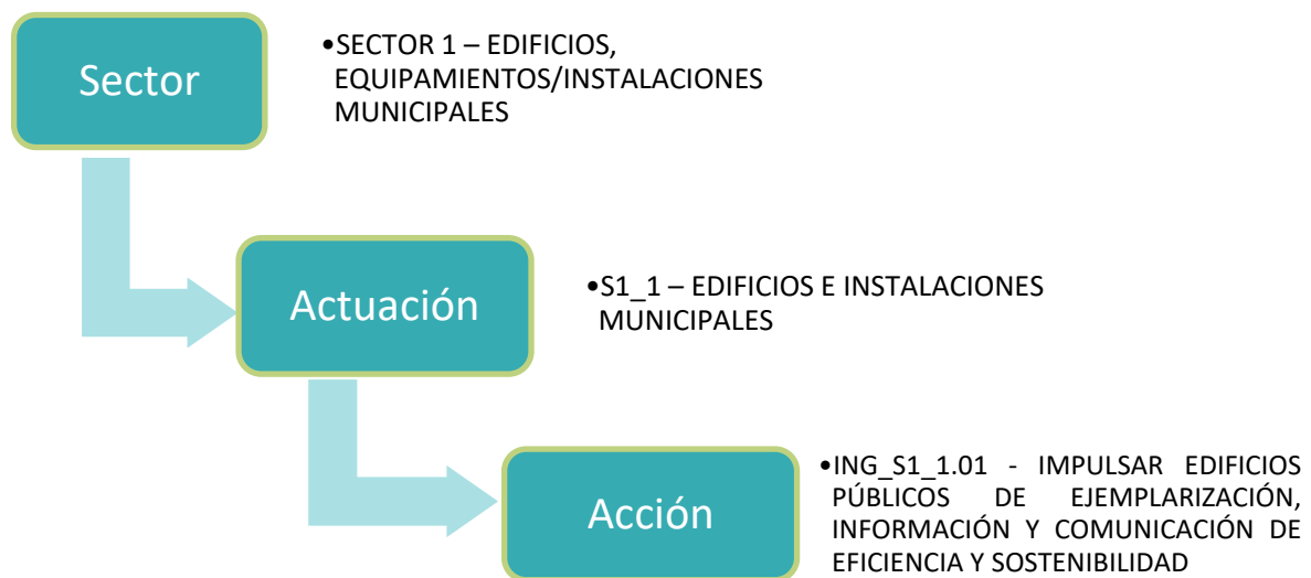
Gráfico 2. Diagrama de la dependencia de las acciones dentro del plan de acción.

Las acciones definen las medidas de mejora propuestas que van desde la aplicación directa sobre los elementos consumidores de energía, hasta el planteamiento de medidas dirigidas a ámbitos más generales como pueden ser colectivos concretos, que hacen uso de la energía o tienen incidencia en su actividad sobre ella.