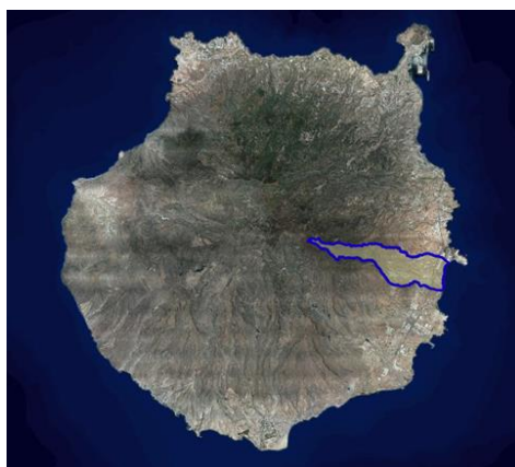
Figura 1. Ubicación del Municipio de Ingenio.

El municipio de Ingenio, perteneciente a la provincia de Las Palmas, se encuentra enclavado en una pendiente de 1.200 metros de altitud sobre el nivel del mar en su punto más alto, en la Caldera de los Marteles hasta llegar a los 310 metros de altura en la zona del casco de Ingenio. Constituye una estrecha franja de tierra que se extiende desde la cumbre al mar siendo de forma triangular el espacio ocupado por dicho municipio. Sus límites lo forman el Barranco del Draguillo - Aguatona al norte, que sirve de divisoria con el municipio de Telde, al sur el Barranco de Guayadeque que establece los límites con el municipio de Agüimes, al oeste con Valsequillo y al este, al igual que todos los municipios de la comarca del sureste con el mar.