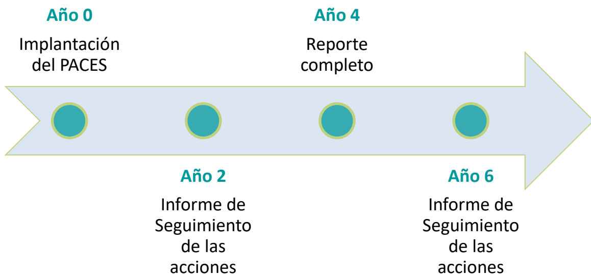
Gráfico 4. Proceso de Implantación y Monitorización del Plan de Acción.

La presentación de este Inventario de Emisiones de Monitorización es obligatoria cada cuatro años, de este modo que el municipio deberá llevar a cabo alternativamente, cada 2 años, un documento de “Informe de Seguimiento” (sin inventario de monitorización) y un “Reporte completo” que contenga el informe de seguimiento junto al inventario de emisión de monitorización.