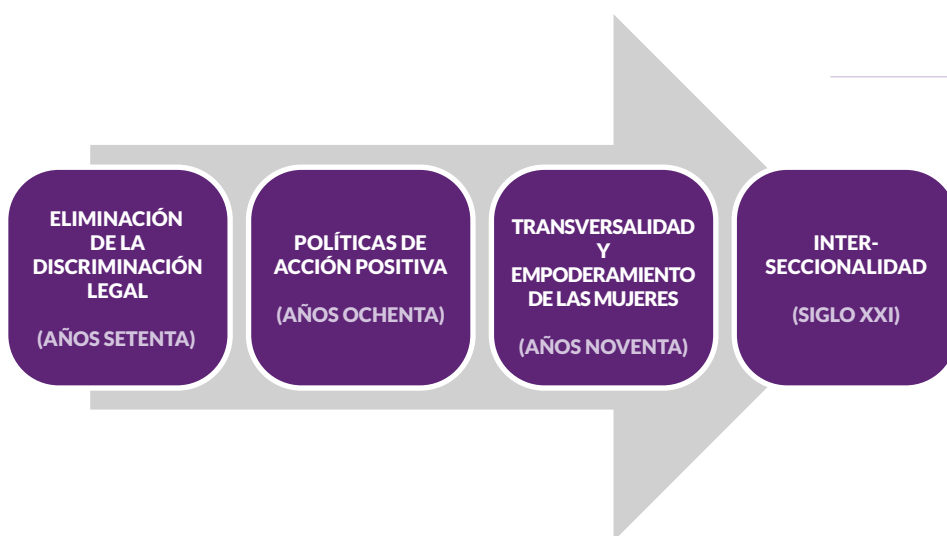
Gráfico I. Diferentes modelos de políticas públicas de igualdad

Sujeto a los modelos de políticas públicas de igualdad, se han elaborado diferentes herramientas normativas y declarativas, estrategias y planes que articulan las respuestas institucionales para combatir las desigualdades y discriminaciones por razón de sexo, orientación sexual e identidad de género. Es en este contexto donde se plantea la elaboración del presente marco al proponer un modelo de política pública, de acuerdo con la imprescindible mirada interseccional, en sintonía con otros instrumentos vigentes en la actualidad (3) y desde el reconocimiento del accionar del movimiento feminista.