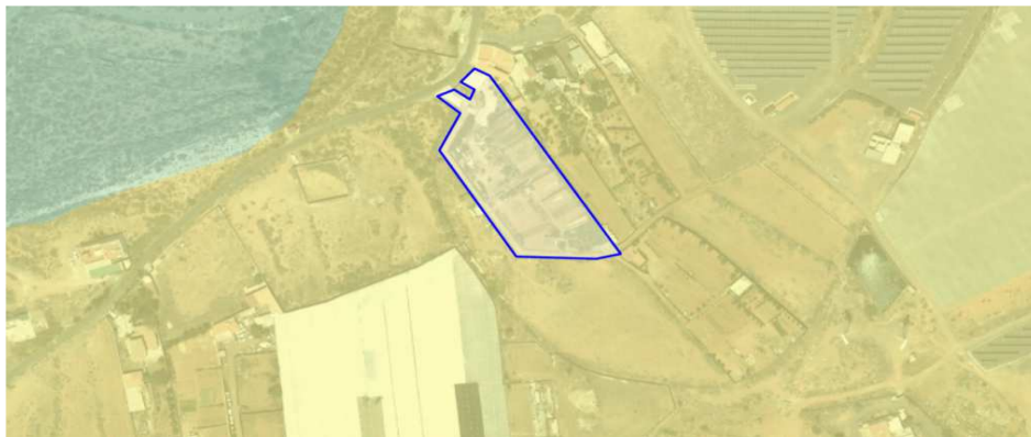
Zonificación PIOGC - Suelo B.b.1.1